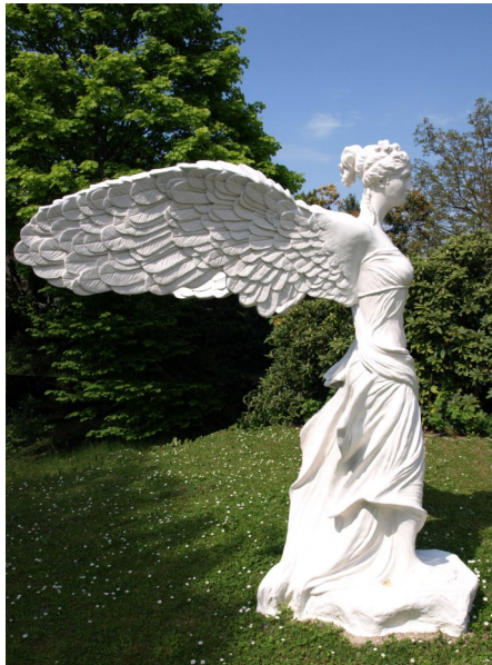
Nike von Samothrake - Caroline Carret -Genf